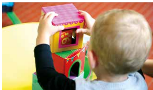
Powstaje Gminny Klub Dzieciocy „Bajka” w Zebrzydowicach – str. 8