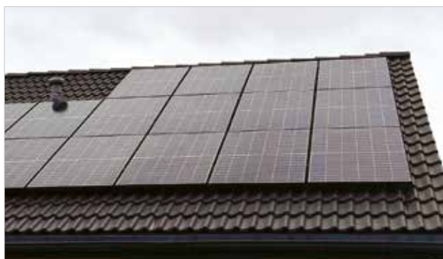
Odnawialne źródła energii dla mieszkańców Bielska-Białej i Zebrzydowic – str. 5