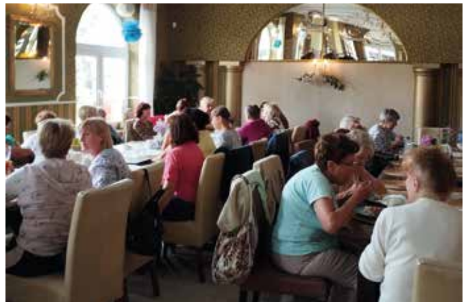
fot. Piknik w Chlebowej Chacie