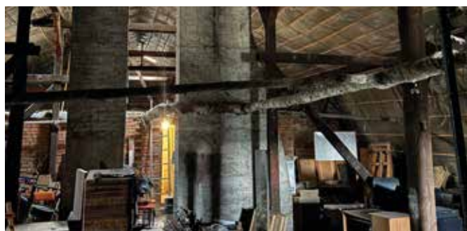
Poddasze pałacu w Zebrzydowicach, to tutaj powstanie „Strefa Lokalnej Kultury i Tradycji”

Pałacu w Zebrzydowicach w celu zwiększenia przestrzeni przeznaczonej na działalność kulturalną. Dzięki temu Gminny Ośrodek Kultury stanie się nowoczesnym, wielofunkcyjnym centrum, oferującym różnorodne zajęcia kulturalne, edukacyjne i animacyjne dla wszystkich mieszkańców, w tym osób z niepełnosprawnością.