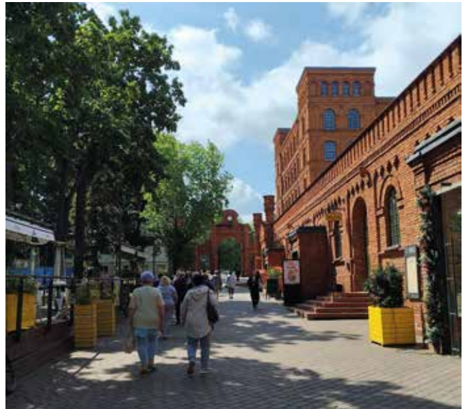
fot. Wyprawa do Łodzi

Lipiec seniorzy spędzili w Górkach Wielkich, gdzie odbył się Piknik Koła. W tym roku gospodarzem była „Chlebowa Chata”, a atrakcją – wspólny wypiek podplomyków. Tradycyjne receptury i zapach świeżo upieczonego chleba stworzyły atmosferę, w której każdy poczuł się częścią wspólnoty.