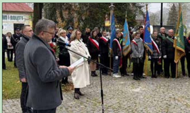
Patriotyczne obchody Święta Niepodległości