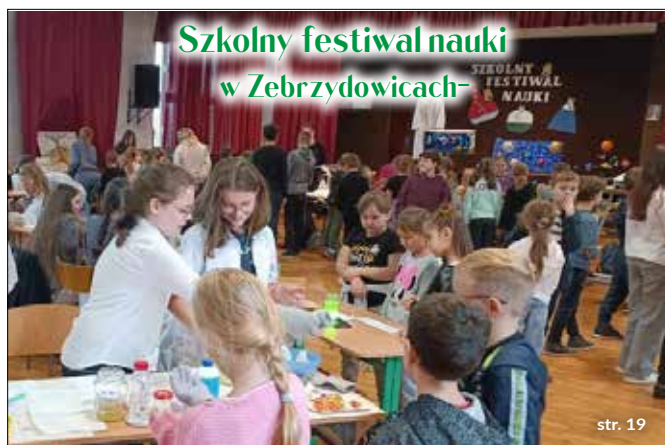
Szkolny festiwal nauki w Zebrzydowicach