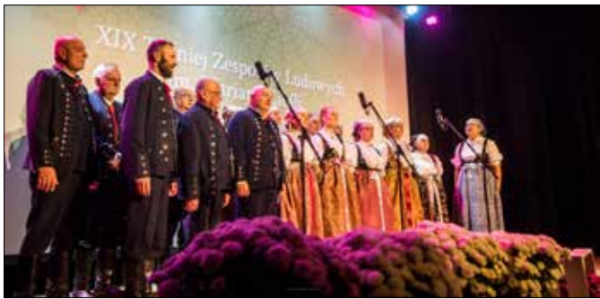
Zespół Małokończanie podczas konkursu.

Tegoroczną Suszeczką Jesień Kulturalną zainaugurował XIX Turniej Zespołów Ludowych im. M. Cieśli „Jak ze Susca powandruje”. Impreza odbyła 4 listopada w sali widowiskowej GOK w Suszcu.