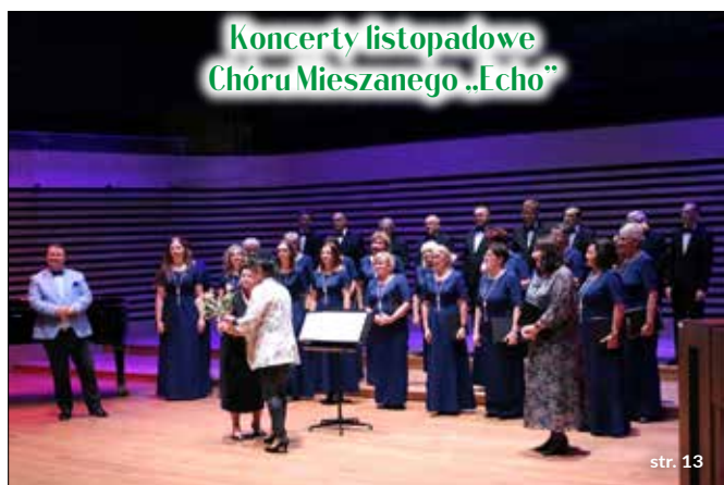
Koncerty listopadowe Chóru Mieszanego „Echo”