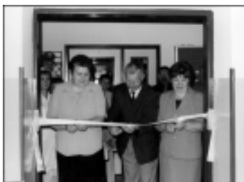
Otwarcie sklepu samoobsługowego w Zebrzydowicach.

Spółdzielnia „Samopomoc Chłopska” w Zebrzydowicach otworzyła w dniu 1 lipca br., w przeddzień „Dnia Spółdzielni”, we własnym pawilonie handlowym odnowione (po generalnym remoncie) stoisko. W uroczystym otwarciu udział wzięli Przedstawiciele Władz