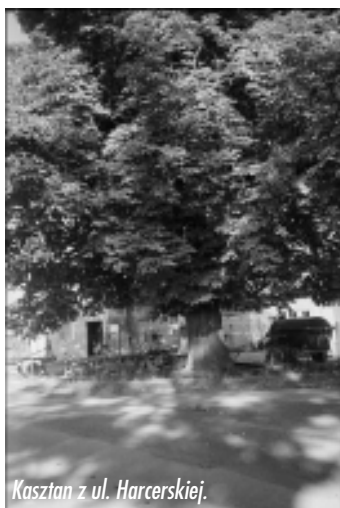
Kasztan z ul. Harcerskiej.

lipę drobnolistną tuż obok pasa drogi ulicy Morcinka. Lipa ta w chwili obecnej nie wymaga żadnych zabiegów pielęgnacyjnych. Miejscem, w którym rosną najpiękniejsze dęby w Kaczycach, jest potok w „Kaczyczym Lesie” w pobliżu ulicy Matejki, rośnie tam 6 wspaniałych dębów liczących po około 150 lat.