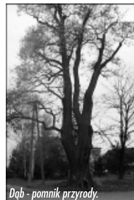
Dąb - pomnik przyrody.

Okazuje się, że i dawni i obecni mieszkańcy Kaczyc reagują w podobny sposób na ważne wydarzenia w kraju (jakim było powstanie styczniowe czy tysiąclecie państwa) i starają się, aby pozostał po nich widoczny ślad na ziemi.