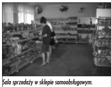
Sala sprzedaży w sklepie samoobsługowym.

Okres do lat 70-tych to rozbudowa sieci handlowej, której oferta kierowana była do rolników. Uruchomiono także piekarnię, rozlewnię, a także sieć lokali gastronomicznych. Lata te i następne to również częste zmiany organizacyjne i dydaktyczne dokonywane przez organa nadrzędne nad Spółdzielnią - łączenie z sąsiednimi Gminnymi Spółdzielni, likwidowanie niektórych i przejęcie innych placówek oraz zmiany personalne w kierownictwie spółdzielni.