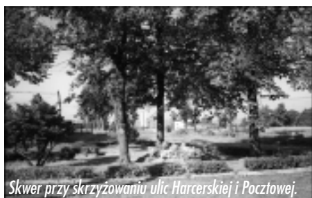
Skwer przy skrzyżowaniu ulic Harcerskiej i Pocztowej.

Kaczyce w ostatnim ćwierćwieczu zmieniły się bardzo. Decyzja o budowie kopalni węgla kamiennego „Morcinek”, jej budowa i rozruch wywarły duży wpływ na mieszkańców Kaczyc i okolicy. Znalazła się dobra praca blisko domu, wieś rozbudowała się, wypiękniała. Kolejna decyzja, tym razem o zamknięciu kopalni i likwidacji wielu miejsc