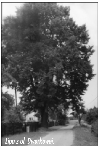
Lipa z ul. Dworkowej.

Na terenie Kaczyc, z uwagi na trochę odrębne położenie miejscowości jak rów-