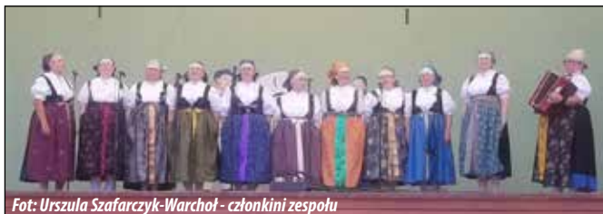
Fot: Urszula Szafarczyk-Warchoł - członkini zespołu