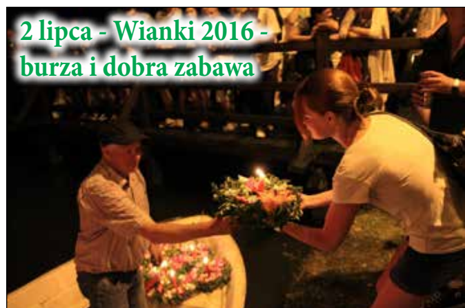
2 lipca - Wianki 2016 - burza i dobra zabawa

MIESIĘCZNIK NR 7 (209) ROK XVII LIPIEC 2016