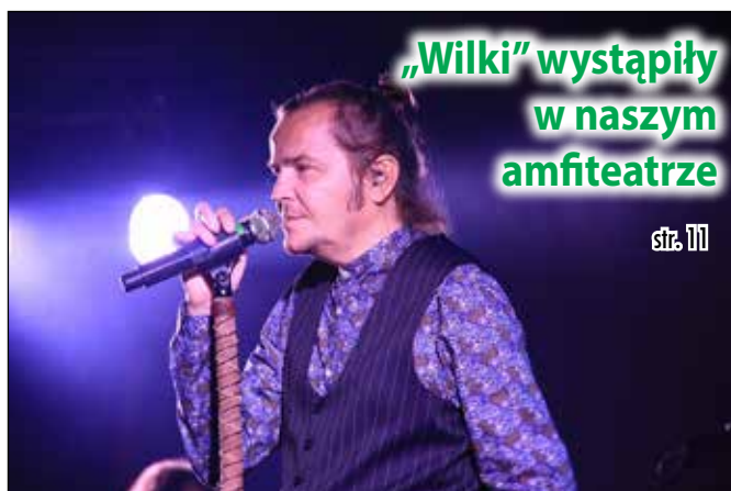
„Wilki” wystąpiły w naszym amfiteatrze