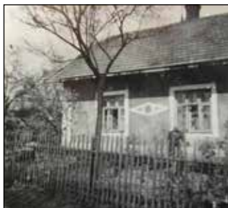
Dom Gromanów nr 278 - wygląd z czasu wojny

Z tych osób obecnie żyje i mieszka tam (Zagrodowa 43) tylko Leon Kania . Z opowiadań najbliższych zna pewne szczegóły z czasu frontu: