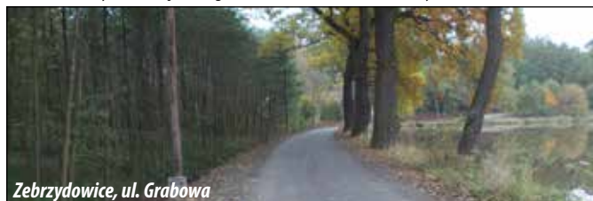
Zebrzydowice, ul. Grabowa

ZEBRZYDOWICE: ul. Grabowa o długości ok. 370 mb pomiędzy skrzyżowaniami z ul. Kalinową. Zakres robót obejmował lokalną wymianę podbudowy kamiennej, ułożenie nawierzchni asfaltowej jezdni wraz z wykonaniem mijanek. Odwodnienie drogi zapewniają zabudowany przyjezdniowy ciek betonowy oraz rów otwarty, umocniony elementami betonowymi na części długości. Koszt zadania - ok. 130 tys. zł;