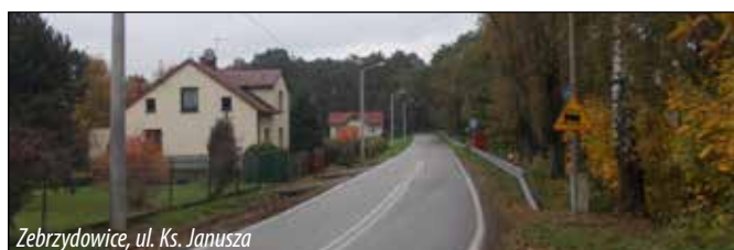
Zebrzydowice, ul. Ks. Janusza

Do realizacji pozostał etap III obejmujący odcinek pomiędzy pos. 43 - 45, który planowany jest do wykonania po przebudowie drogi na tej długości. Obecnie przygotowywana jest dokumentacja projektowa zakresu drogowego.