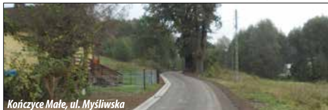
Kończyce Małe, ul. Myśliwska

KOŃCZYCE MAŁE: ul. Myśliwska o długości ok. 260 m. Zakres prac obejmował wykonanie nowej konstrukcji drogi wraz z ułożeniem nawierzchni asfaltowej jezdni ograniczonej jednostronnie betonowym ciekim. Odwodnieniem jezdni odbywać się będzie kanalizacją deszczową oraz rowem otwartym. Koszt zadania - ok. 208 tys. zł