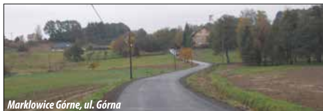
Marklowice Górne, ul. Górna

MARKLOWICE GÓRNE: ul. Górna o długości łącznej ok. 260 mb. Wykonany zakres stanowił IV i zarazem ostatni etap jej naprawy i obejmował ułożenie nowej nawierzchni asfaltowej jezdni i zjazdów wraz z wymianą kanału deszczowego w rejonie przedszkola. Koszt zadania - ok. 102 tys. zł