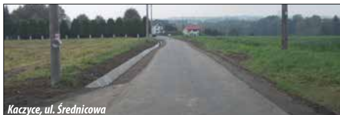
Kaczyce, ul. Średnicowa

KACZYCE: ul. Średnicowa o długości łącznej ok. 190 m. W ramach prac wykonana została nowa nawierzchnia asfaltowa jezdni, parkingu wzdłuż cmentarza, zjazdów oraz odtworzono odwodnienie drogi umocnionym rowem otwartym. Koszt zadania - ok. 98 tys. zł