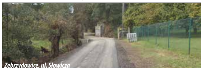
Zebrzydowice, ul. Słowicza

droga boczna od ul. Słowiczej o długości ok. 100 mb. W trakcie prac demontażu podana została część mostu kolejowego na nieczynnej linii kolejowej Zebrzydowice - Jastrzębie Zdrój, co zapewni dojazd do posesji zlokalizowanych na przyległym obszarze bez ograniczenia skrajni pionowej. Jezdnia przebudowanej drogi uzyskała nową nawierzchnię asfaltową, zaś na odcinku istniejących urządzeń podziemnych ułożona została kostka betonowa. Koszt zadania - ok. 65 tys. zł