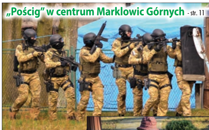
„Pościg” w centrum Marklowic Górnych - str. 11

MIESIĘCZNIK NR 4 (218) ROK XVIII KWIECIEŃ 2017