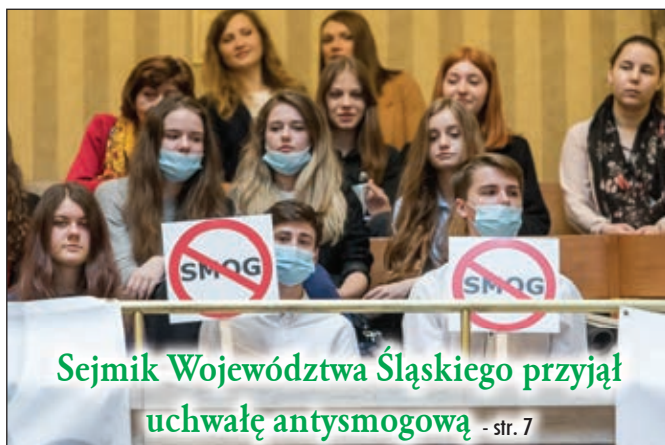
Sejmik Województwa Śląskiego przyjął uchwałę antysmogową - str. 7