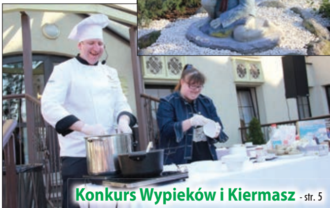
Konkurs Wypieków i Kiermasz - str. 5