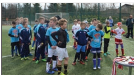
Z życia Szkółki Piłkarskiej - str. 17