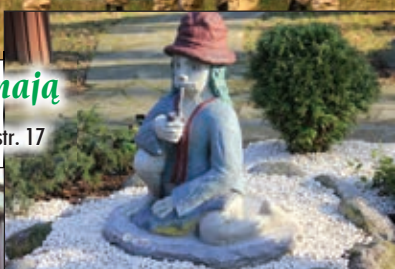
Kończyce Małe mają pomnik Utopca - str. 17